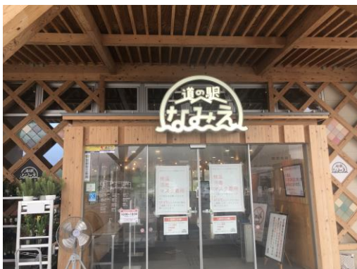
[図表2] 無印良品が出店する「道の駅なみえ」の店内の様子